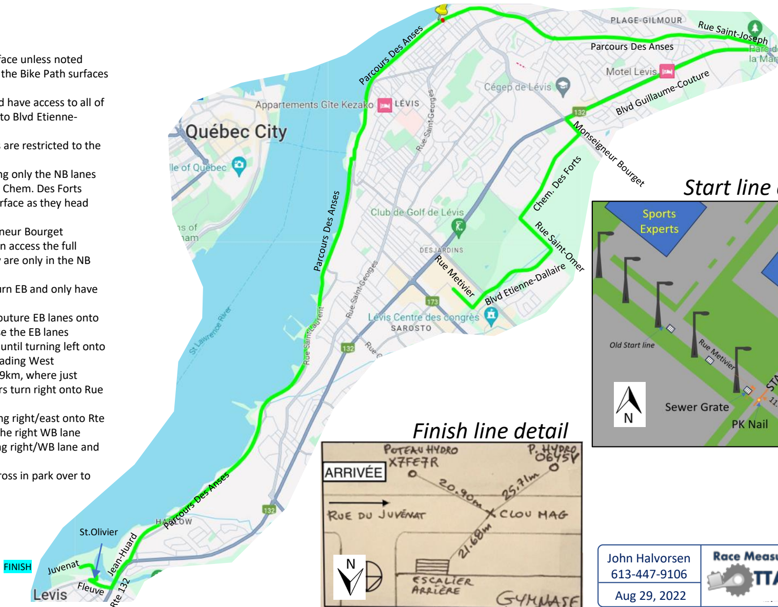
Start line detail